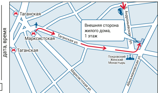
ул. Большая Андроньевская, д. 25/33 (от метро 15 мин. пешком)