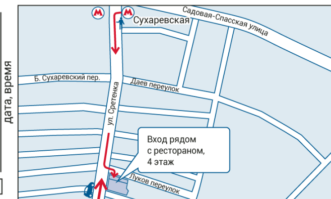
ул. Сретенка, д. 16/2 (от метро 7 мин. пешком)