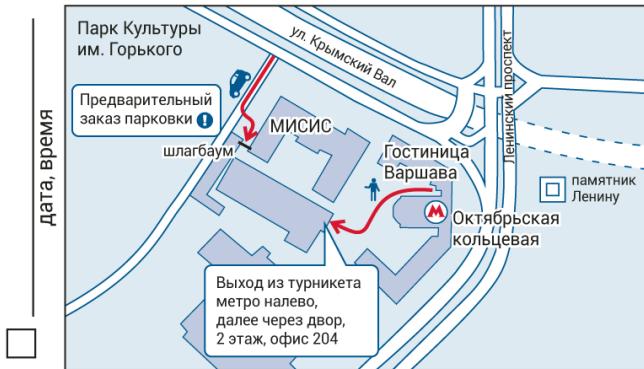
ул. Крымский Вал, д. 3, стр. 2 (от метро 1 мин. пешком)