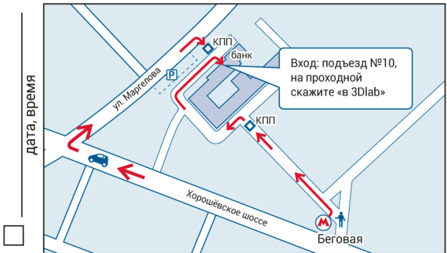
Хорошевское шоссе, д. 32а, под.10 (от метро 6 мин. пешком)